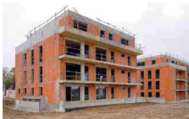
En 2013, les aides financières encouragent la construction de logements très économes en énergie.

Le prêt à taux zéro+ est réservé aux logements respectant la réglementation thermique 2012 ou dont le niveau de performance énergétique est certifié par l'obtention du label «bâtiment basse consommation, BBC 2005».