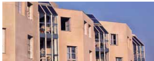
Propriétaires, bailleurs, locataires en habitat collectif peuvent bénéficier du crédit d'impôt.

les gros appareillages de chauffage collectif des immeubles et ceux permettant la régulation, la programmation du chauffage, le comptage individuel et la répartition des frais de chauffage (voir p. 12-13) peuvent bénéficier du crédit d'impôt .