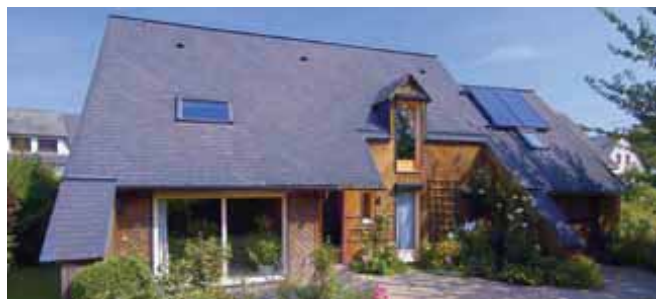
L'isolation du toit est essentielle car 25 à 30 % de la chaleur s'échappe par la toiture.

*** pour ces travaux portant sur des éléments multiples, la dépense doit porter sur une partie significative du logement, voir pages 17 et 18.